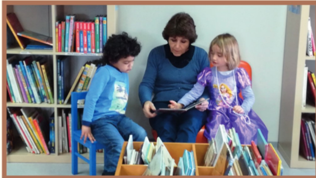
Boîte à livres nouvellement installée